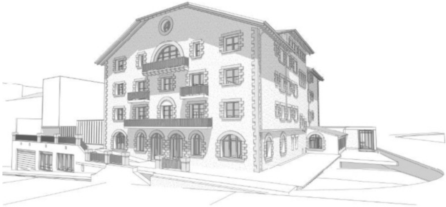
E. Dilmé; X. Orteu; J. Vidal. Projecte de conservació, posada en valor i rehabilitació de l'hotel Rosaleda, 2015