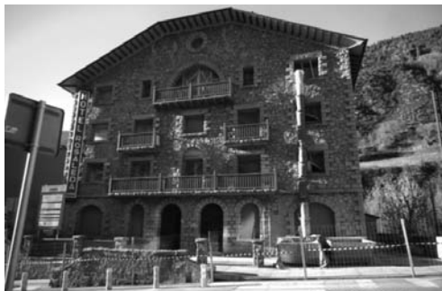
E. Dilmé, 2016